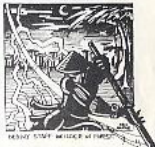
DEADLY STAFF WELTER IN FOREST