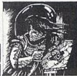
VALEVRIE IN CASTLE

Es wird eine große Aufgabe sein, mit diesen rasenden Amazonenkämpfern, die von der niederen O stammte Trindor kommen, Schritt zu halten.